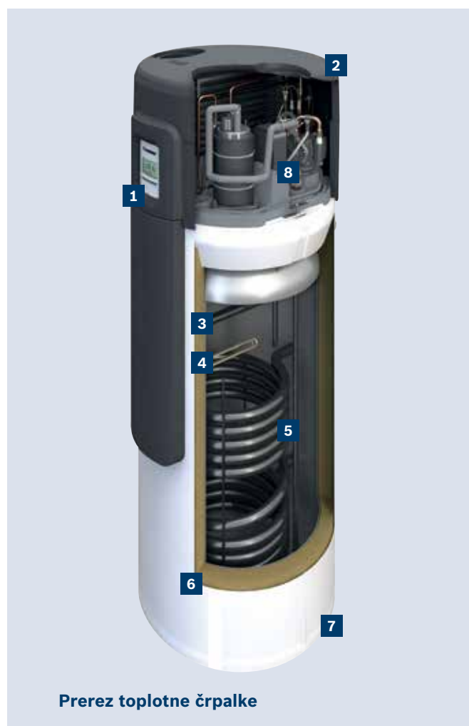
Prerez toplotne črpalke